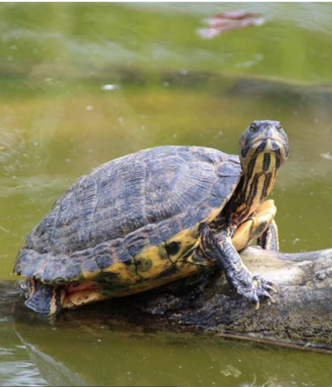
Gulbukig vattensköldpadda.

Det finns tre underarter, rödörad, gulbukig och gulörad vattensköldpadda och de är en av de mest invasiva arterna i världen, troligen som en följd av att det är ett populärt husdjur som ofta släpps ut i naturen när man tröttnat på den. Den är med på EU:s lista över invasiva främmande arter.