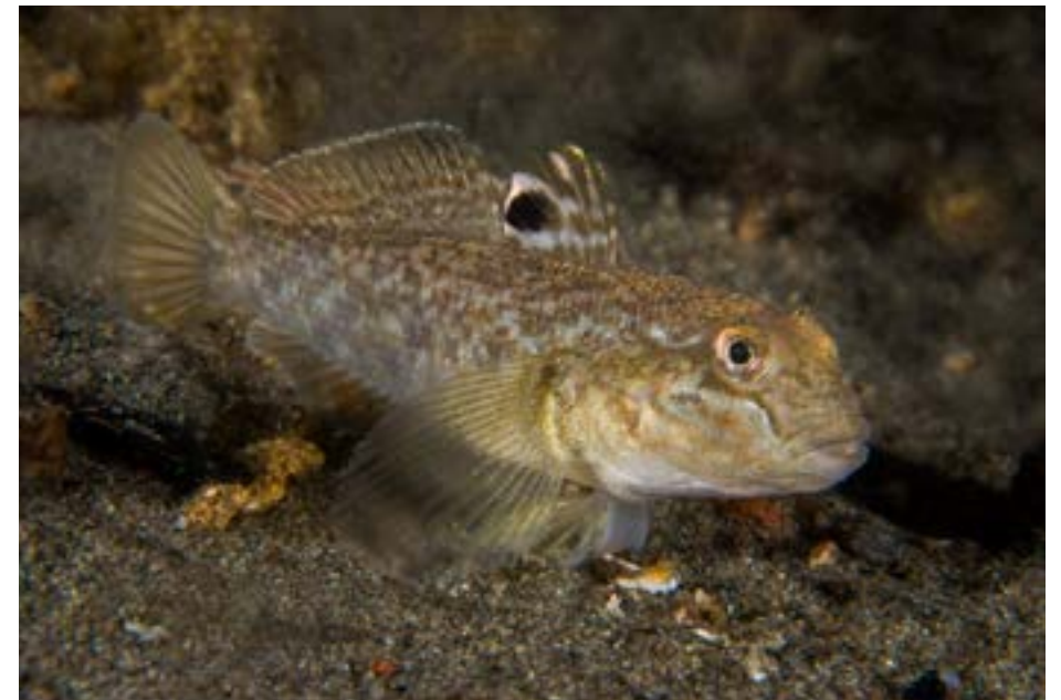
Svartmunnad smörbult klarar av att leva i både sött och salt vatten. Den känns igen på att den har en karaktäristisk svart fläck på bakre delen av den främre ryggfenan Foto: Anders Salesjö/Havs- och vattenmyndigheten.

Den lever framförallt i grunda vatten ner till 20 meters djup på olika typer av botten där det finns gott om musslor och snäckor, som utgör huvudfödan. Den kan också äta andra fiskars rom och kräftdjur. Den svartmunnade smörbulten utgör själv föda åt flera kustnära rovfiskar såsom abborre, gädda, torsk och piggvar. Den svartmunnade smörbulten har varierat kraftigt i antal under åren, vilket tyder på att populationsstorleken varierar och går lite upp och ner. Fisken är ätbar och används som matfisk i sitt ursprungsområde.