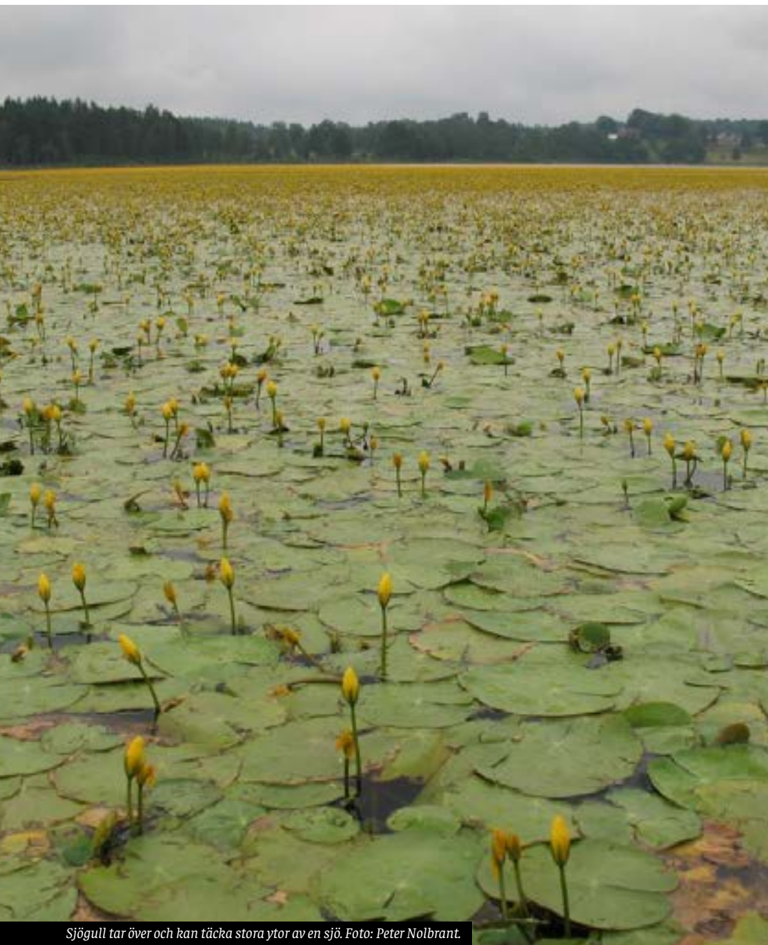
Sjögull tar över och kan täcka stora ytor av en sjö.

Sjögull är en flytbladsväxt som ursprungligen kommer från Centraleuropa och Asien. Under slutet av 1800-talet infördes den som prydnadsväxt i svenska dammar.