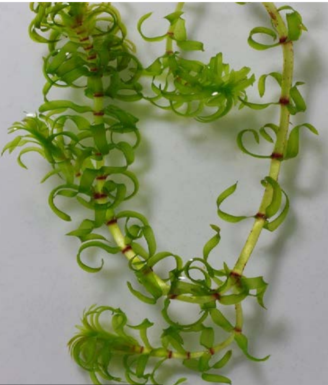
Smal vattenpest Foto: Christian Fischer (CC BY-SA 3.0).

Smal vattenpest och vattenpest kommer båda från Nordamerika. De har spridit sig till våra sjöar och vattendrag genom att vi tömt ut akvariets innehåll i vår natur. Smal vattenpest är med på EU:s lista över invasiva främmande arter.