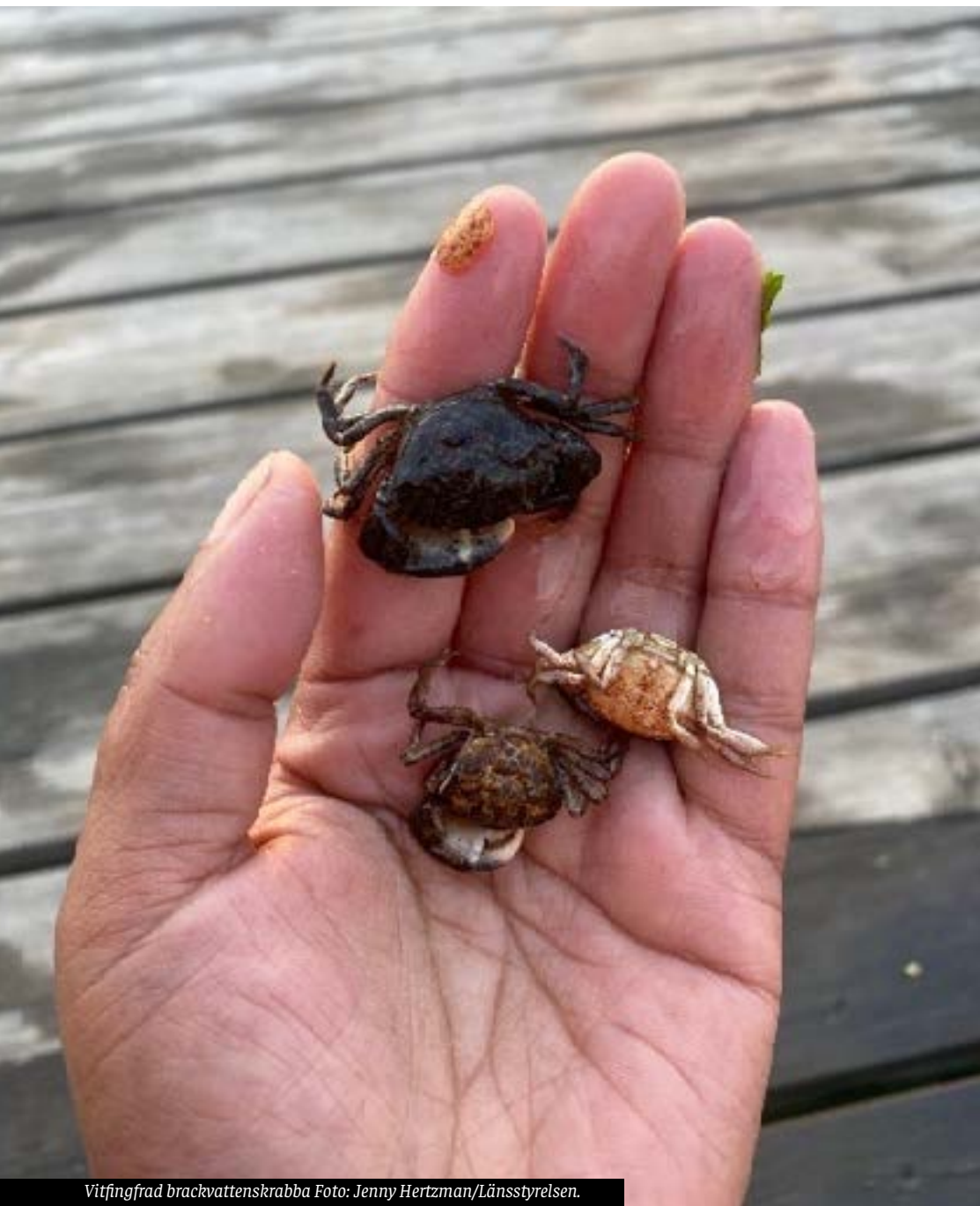
Vitfingrad brackvattenskrabba

Den vitfingrade brackvattenskrabban är en liten krabba som upptäcktes första gången år 2014 i Blekinges kustvatten.