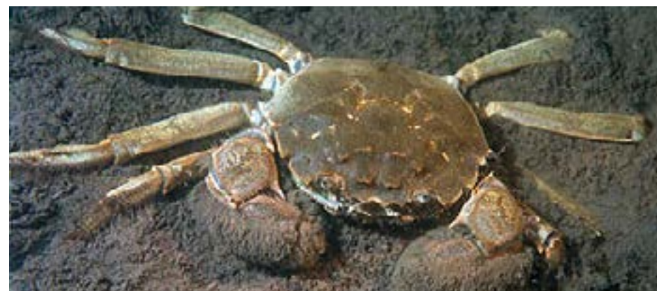
I Sverige har kinesiska ullhandskrabbor hittats både i kustvatten och i flera av de större sjöarna. Varje år rapporteras det in ett antal fynd i Blekinges kustvatten.

Som vuxna lever kinesiska ullhandskrabbor i söt- och brackvatten, ofta nedgrävda i mjukbotten. De är allätare och livnär sig på växter, fiskrom och olika slags smådjur. När de blivit könsmogna, vid fem års ålder, vandrar de nedströms mot havet för att föröka sig. Hannen dör strax efter parning och honan ett år senare när äggen kläcks. Kinesisk ullhandskrabba kan orsaka skador för fiske och vattenbruk, genom att förstöra redskap och ta fångst. Eftersom den gräver och bygger gångar, kan den underminera strandkanter och flodbankar. Kinesisk ullhandskrabba kan sprida sjukdomar och parasiter.