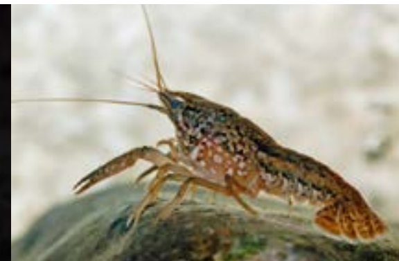
Marmorkräftan utmärker sig med sitt grönskimrande skal.

Marmorkräftan trivs bäst när vattentemperaturen är mellan 20-25 grader men kan överleva i kallare vatten. Marmorkräftan har varit ett populärt akvariedjur. Den är nu med på EU:s lista över invasiva främmande arter.