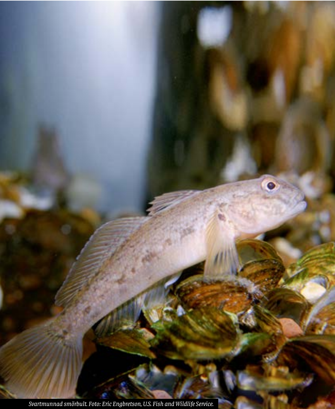
Svartmunnad smörbult.

Den svartmunnade smörbulten som har sitt ursprung i Svarta och Kaspiska havet har nu etablerat sig i Blekinges kustvatten. Det är en tålig bottenlevande fisk som sprider sig i våra vatten.