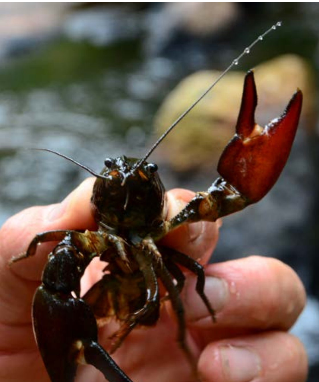
Signalkräfta med den karakteristiska ljusa fläcken i klons "tumgrepp".

Signalkräftan kommer ursprungligen från Nordamerika och introducerades avsiktligt till svenska vatten på 1960-talet. Signalkräftan är med på EU:s lista över invasiva främmande arter.