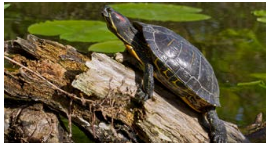
Rödörad vattensköldpadda ( Trachemys scripta elegans ).

Den är anpassningsbar och kan leva i både sjöar, dammar och vattendrag där den äter både vattenväxter och djur. Den kan förutom att äta upp inhemska skyddsvärda arter även sprida allvarliga djursjukdomar. Vissa sjukdomar som salmonella kan även spridas till människor. I Sverige kan den ännu inte reproducera sig ute i naturen, men med ett varmare klimat finns det en risk att detta kan ske i framtiden.