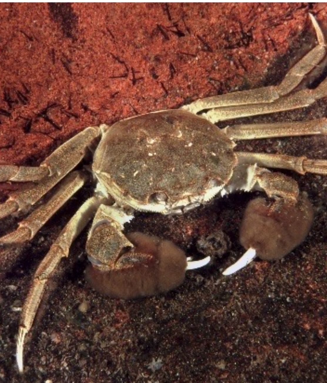
Kinesisk ullhandskrabba.

I Sverige har kinesiska ullhandskrabbor hittats både i kustvatten och i flera av de större sjöarna. Varje år rapporteras det in ett antal fynd i Blekinges kustvatten. Den kinesiska ullhandskrabban är med på EU:s lista över invasiva främmande arter.