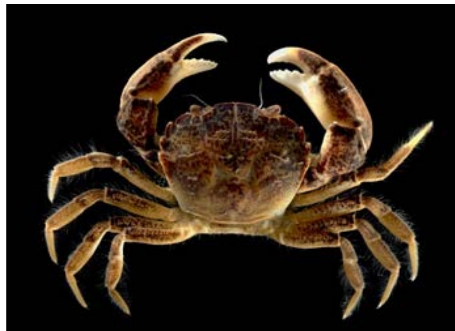
Vitfingrad brackvattenskrabba är mycket små krabbor.

Krabban lever framförallt i brackvattensområden men även i sötvatten. Den kan däremot inte fortplanta sig i sötvatten. Krabban lever oftast på grunt vatten men förekommer ner till 35 meters djup, på leriga, sandiga eller steniga bottenar. Krabban konkurrerar om mat och utrymme med våra inhemska arter som kan trängas ut. Eventuellt kan den också överföra sjukdomar. När de finns i täta bestånd kan de samlas vid fiskeredskap och förstöra fångsten.